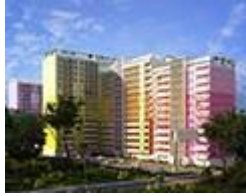
ЖК Панорамный городок от 13'000 грн/м2