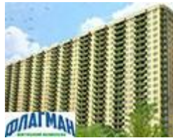
ЖК Флагман от 11'800 грн/м2