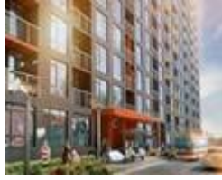
ЖК Олимпийский городок от 14'500 грн/м2