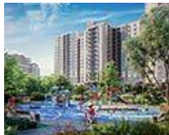
ЖК Шевченковский от 26'200 грн/м2