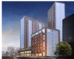
ЖК L-Квартал от 22'000 грн/м2